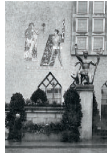
4 Mosaik „Krieg und Frieden“ von August Babberger und Skulptur „Der Junge Neckar“ von Johann Wilhelm Fehrle. Foto um 1928.

Die Repräsentations-, Schalter- und Büroräume liegen mit ihren Fensterfronten der Straße zugewandt, entlang der um den Innenhof angeordneten Flure. Erst im Dachgeschoss wandelt sich dieses Prinzip. Die damals für einen späteren Ausbau