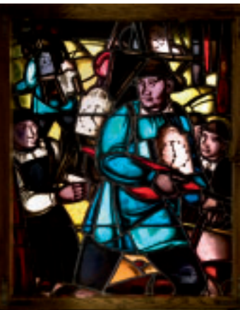
12 Farbglasfenster, Krätzenträger, nach Entwurf von Emil Glücker 1928. Foto 2013.