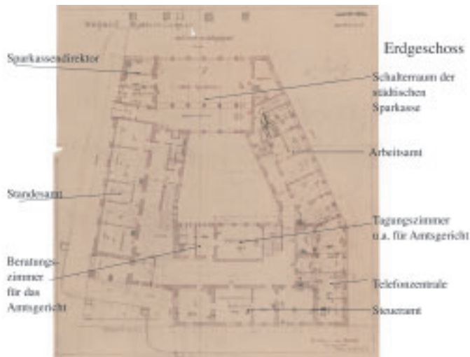
6 Grundrisszeichnung des Erdgeschosses von Hans Herkommer 1926.