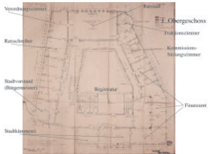
7 Grundrisszeichnung des ersten Obergeschosses von Hans Herkommer 1926.

zu Büroräumen vorgesehenen Bereiche haben ihre Fensterbänder zum Innenhof. Die straßenseitig aufgesetzten Einzelgauben durchlichteten die Flurbereiche. Im Untergeschoss waren technische Versorgungsräume, die Garage für das Dienstfahrzeug des Bürgermeisters, zwei Wannenbäder und drei Duschzellen für städtische Bedienstete, der über eine Treppe von der Sparkasse aus zugängliche Tresorraum und die Wohnung des Hausmeisters untergebracht. Das Erdgeschoss beherbergte neben der Sparkasse unter anderem Standesamt, Steueramt, Telefonzentrale und Arbeitsamt. Die Integration des Arbeitsamtes senkte die Gesamtbaukosten. Ein Erlass des Reichsarbeitsministers von Juni 1925 sah bei Errichtung von Arbeitsämtern die Drittelung der Bausumme zwischen Reichsarbeitsverwaltung, der jeweiligen Landesbehörde und der Kommune vor. In Bezug auf Gestaltung hieß es in dem Erlass: „Bei der Errichtung der fraglichen Gebäude ist jeder entbehrliche Aufwand zu vermeiden.“ Der unscheinbare Hinteringang an der Marktstraße folgt der Empfehlung aus der damaligen Fachliteratur, das Arbeitsamt „innerstädtisch zentral, jedoch in einer kleinen Nebenstraße“ anzusiedeln. Im ersten Obergeschoss befanden sich die Räume des Stadtrates, der Stadtkasse und Stadtkämmerei. Das zweite Obergeschoss war dem Bauamt vorbehalten.