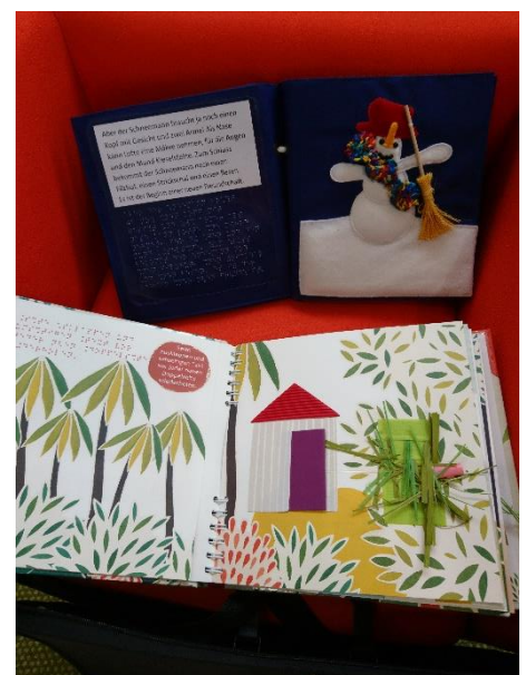
Kinderbücher aus den Medientaschen in Schwenningen: in Braille-Schrift sowie Druckschrift für Normalsichtige und mit Illustrationen, die für die taktile Wahrnehmung in besonderer Weise gestaltet sind.