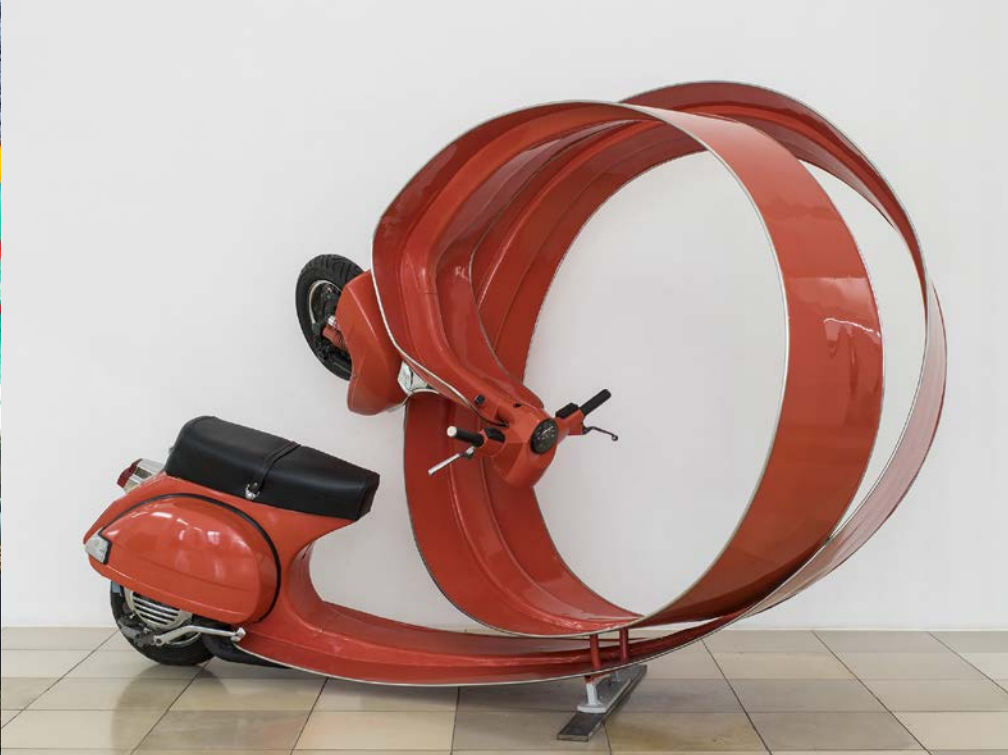
Eingangsfoyer Museum Art.Plus: Stefan Rohrer, Vespa, 2007

2009 eröffnete das Museum Art.Plus in Donaueschingen. Ausgehend von der hauseigenen Sammlung präsentiert das idyllisch am Schlosspark und unmittelbar gegenüber der Donauquelle gelegene Kunsthaus ausgesuchte Positionen internationaler zeitgenössischer Kunst. Die lichtdurchfluteten Schauräume des aufwendig renovierten und erweiterten Museumsbaus aus dem 19. Jahrhundert bieten eine einmalige Kulisse für die Kunst unserer Zeit.