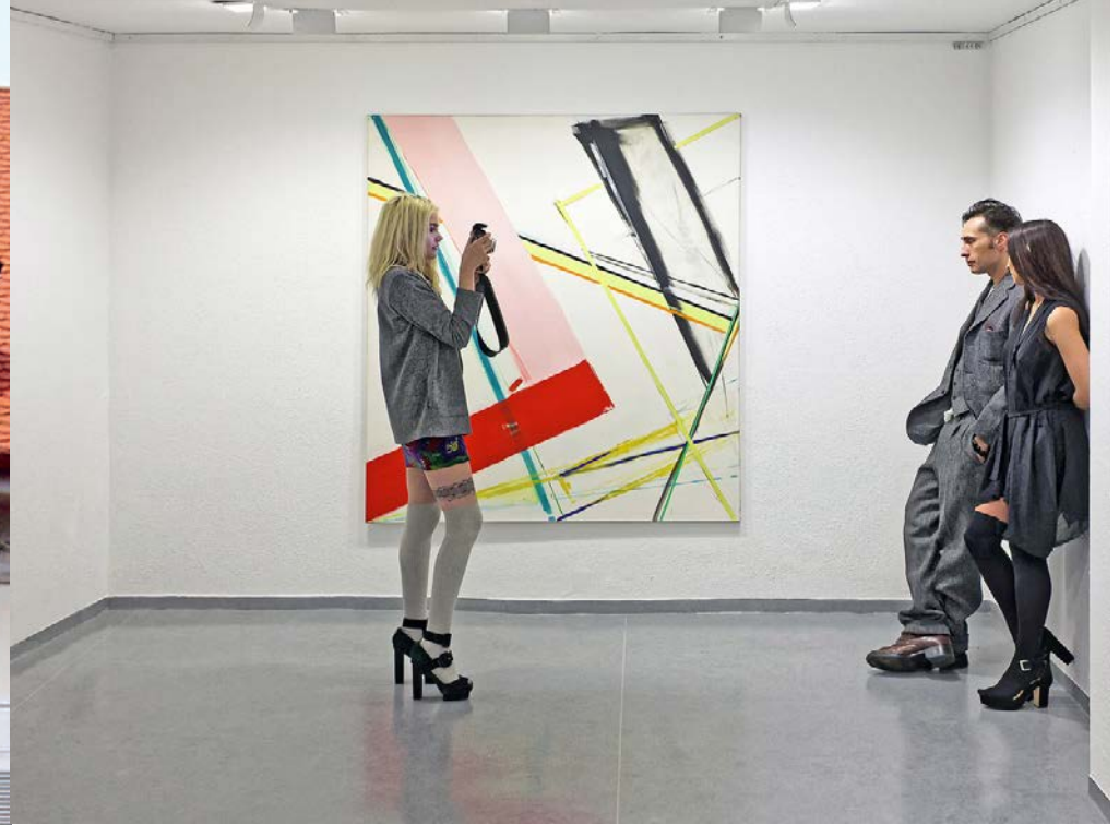
Ausstellung ,private view 2', 2015