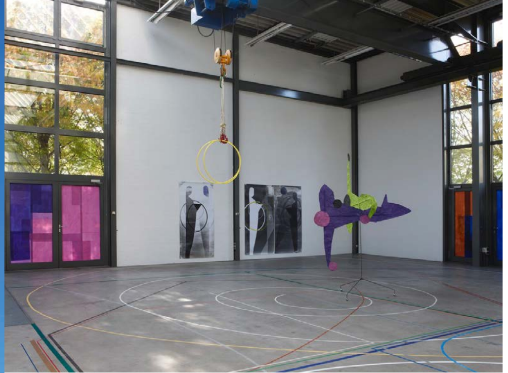
Ausstellung Katin Lindena, Blick in die Werkstatt, im Rahmen des Werkstattpreises 2011

Am Rande Rottweils breitet sich das Kunst-, Arbeits- und Wohnareal von Erich Hauser (1930-2004) aus, ein Gesamtkunstwerk, das sich als stimmige Verbindung von Architektur, Edelstahlskulpturen und Natur präsentiert. Der Skulpturenpark mit Werken aus den 1960er Jahren bis 2003 sowie die umfangreiche Kunstsammlung Erich Hausers mit dem Schwerpunkt auf Malerei der 2. Hälfte des 20. Jahrhunderts sind an den offenen Sonntagen zu besichtigen. Weitere Führungen auf Anfrage. Veranstaltungsprogramm siehe Homepage.