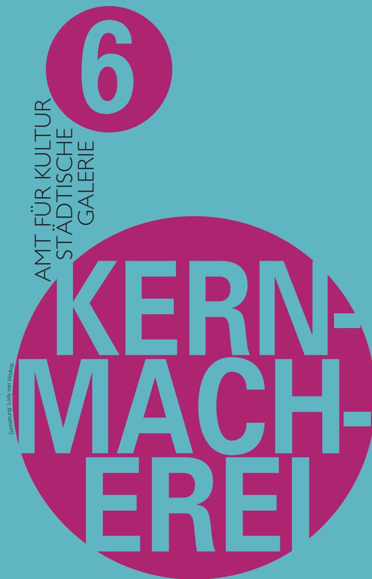
Gestaltung: Lucy van Vliet

tickets@villingen-schwenningen.de www.villingen-schwenningen.de sowie bei allen Vorverkaufsstellen im Ticketverbund Schwarzwald-Baar-Heuberg